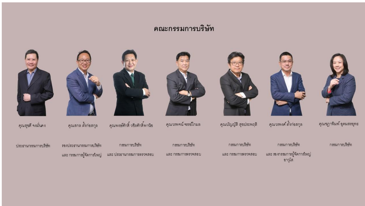
คณะกรรมการบริษัท